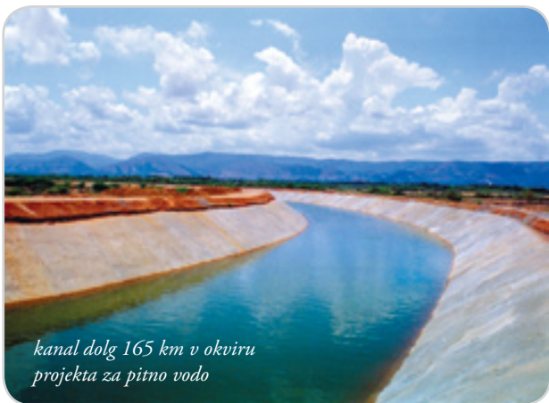
kanal dolg 165 km v okviru projekta za pitno vodo

Sai Baba za izvedbo projektov nikoli ni prosil za denar. Tistim, ki imajo željo, ponudi priložnost prispevati za dobrobit vseh ljudi.