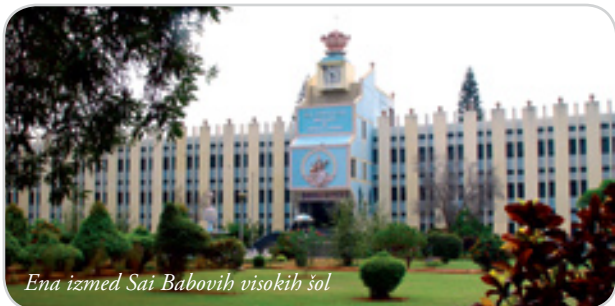
Ena izmed Sai Babovih visokih šol

“Nevednost je največje prekletstvo v življenju. Nevednost je najtežje breme v življenju. Nevednost je najgostejša tema. Nevednost je vzrok neuspeha v življenju. Kdor ne vidi, ni slep. Slep je, kdor noče videti. Vzrok vseh težav je ego. Opustite ego in vse težave bodo izginile.”