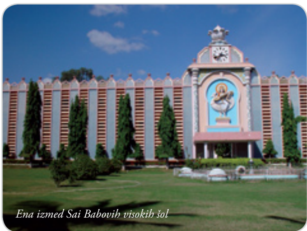
Ena izmed Sai Babovih visokih šol

Diplomanti Sai Babovih fakultet so iskani po vsem svetu, saj poleg akademske odličnosti tudi njihova integriteta zagotavlja poštenost in strokovnost.