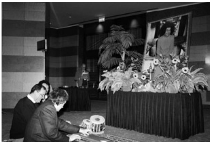
Badjani pred pričetkom

Nedelja je bila namenjena javnosti. Srečanje se je pričelo ob 10. uri. Dvorana je bila nabito polna. Navzočih je bilo okoli 1700 ljudi.