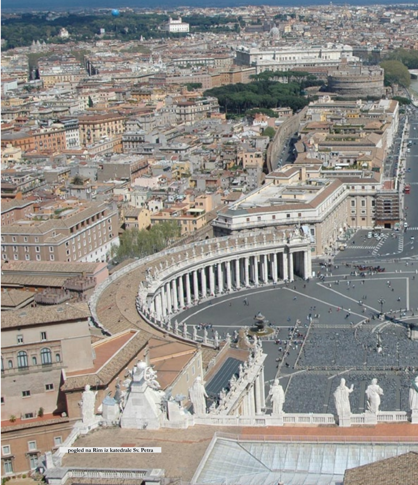
pogled na Rim iz katedrale Sv. Petra