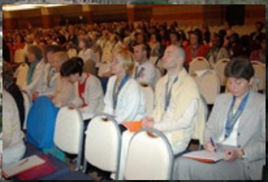
udeleženci iz Slovenije