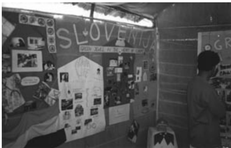
Slovenski kotiček na konferenci

trpljenje so naša lastna dejanja. Baba pravi, da smo okuženi z zavistjo in napuhom. Nekateri nismo samo okuženi, ampak že kar onesnaženi! Onesnaženost pa lahko pozdravimo samo z razsvetljenjem. Zato je bil glavna tema konference SAI!