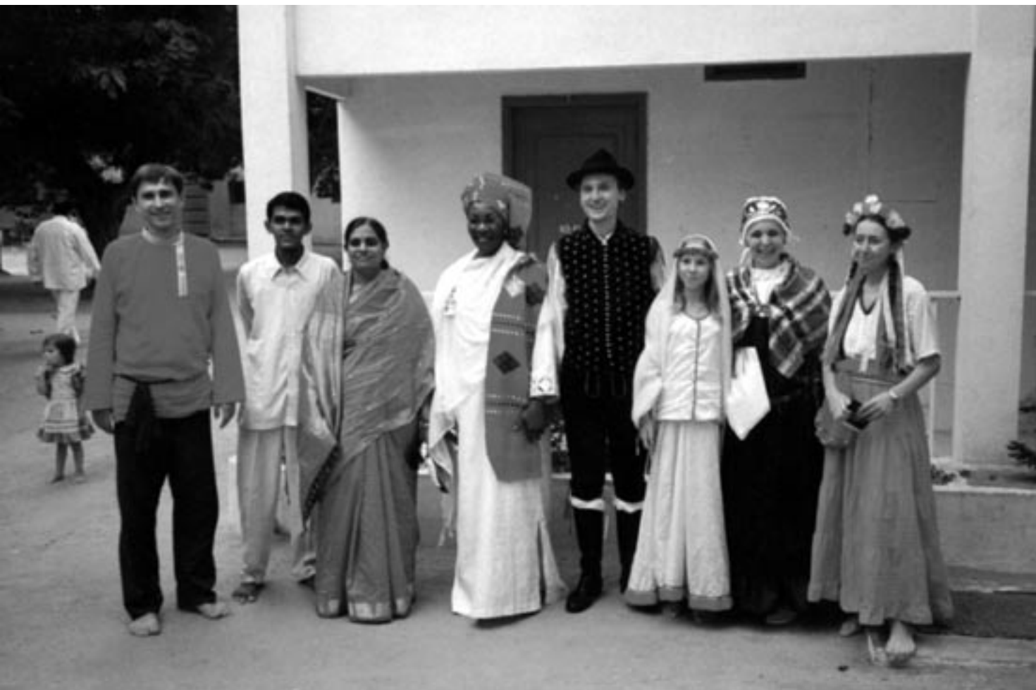
Slovenska delegata na konferenci v narodni noši

kateremu je sporočil celemu svetu, da je namen njegovega prihoda na ta svet pregnati trpljenje revnih in jim zagotoviti vse, kar potrebujejo. Od takrat naprej je Babovo življenje najvišja oblika služenja