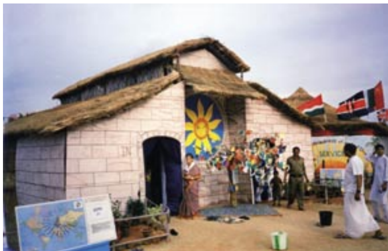
V tej hiši se je v času konference predstavila tudi Slovenija