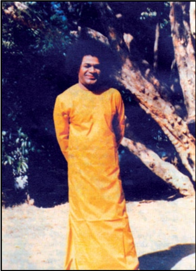
Avtorica je fotografijo posnela v Brindavanu.