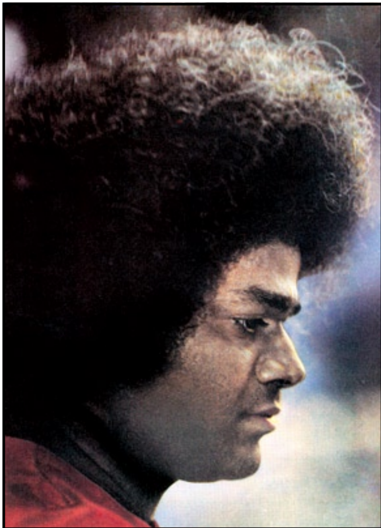
Bhagavan Sri Sathya Sai Baba, rojen 23. novembra 1926.